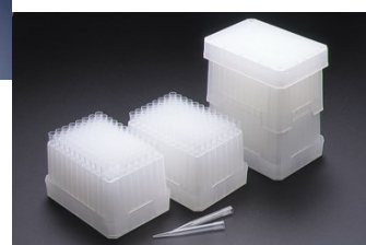
T-1000R (ラック入りチップ)