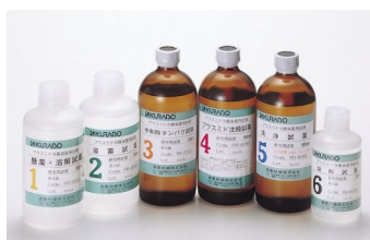
PR-500 (プラスミド試薬キット)