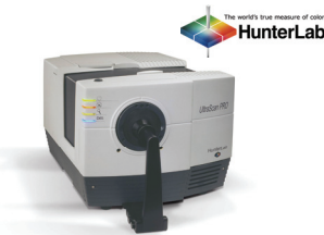
リサーチ分光測色計 Ultra Scan PRO