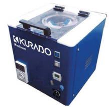
小型攪拌・脱泡装置 OR-V1