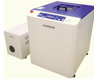
遊星式攪拌脱泡装置マゼルスター KK-V350W