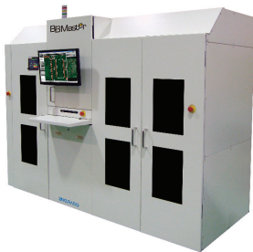
基板外観検査装置 BBMaster-8800 (自動・両面検査タイプ)

さて、弊社では、来る平成 30 年 1 月 17 日(水)より東京ビッグサイトで開催される「第 10 回国際カーエレクトロニクス技術展」で、【EV シフトに対応】をテーマに車載基板用最終外観検査装置 BBMaster、リサーチ分光測色計 Ultra Scan PRO、遊星式攪拌脱泡装置マゼルスターならびに液体・粉体自動計量装置を出展致します。ご多用中とは存じますが弊社ブースに是非ご来場賜りたく、お願い申し上げます。